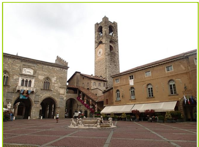
中心部らしき広場

無料Wifiがあったので、ベルガモでググって見たら、「中世の街」とあった。リンク先は登録画面で、電話番号入力選択肢には日本がなく、代わりに、クレジットカード番号が求められたので、自重。