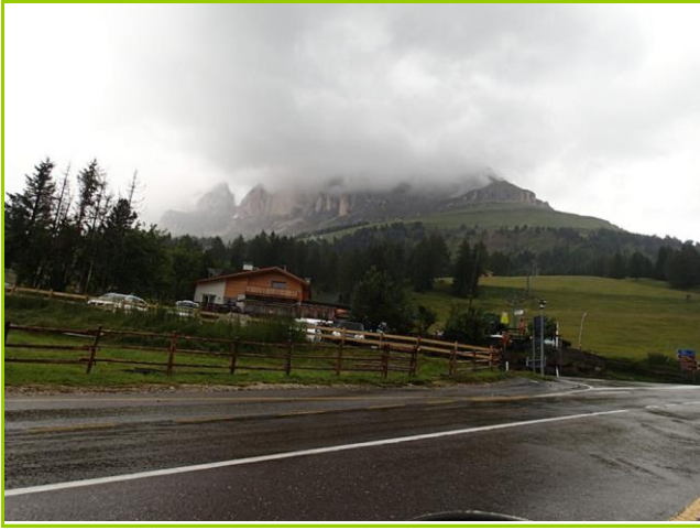
コスタルンガ峠にて

15:40。眼前の山は、Rosengarten3002mか。土砂降りの中、ハイカー達が下山してきた。カナツェイ手前のGSから右折スタート時、左から車がビュッ。左から来るのは手前車線、錯覚に注意。