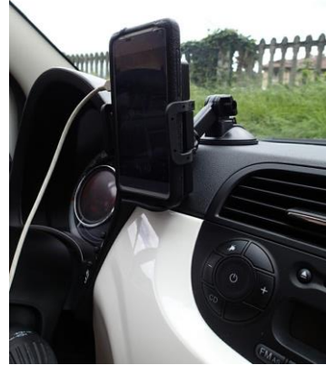
スマホを固定&給電

N、R、そしてDもすぐわかる。A/M(AT/MT切替)はしばらくして、+、-(ギアアップ/ダウン)は、後日やっとわかった。取説読んでもわからない。それから、ワイパーと指示器は左右逆だ。