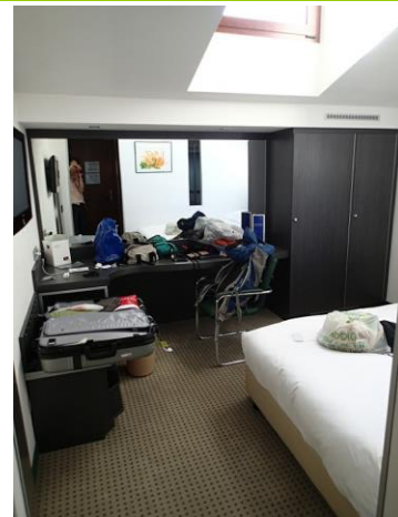
ベルガモのホテル

ボルツァーノの観光協会を入力し、出発(13:00)。 “After 100m at RoundAbout take Second Access!” お～、なるほど!