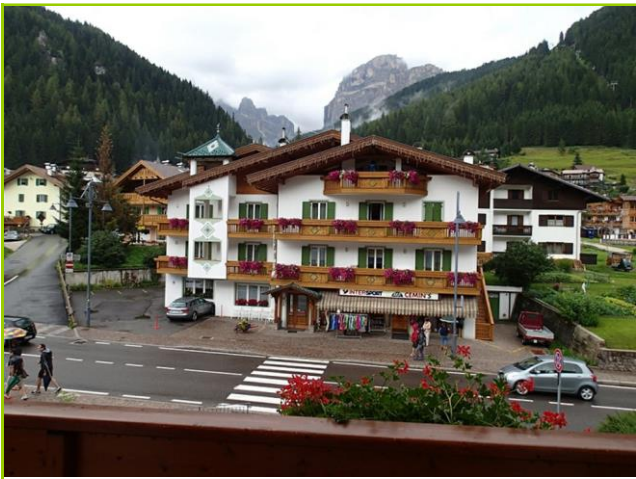
ホテルのベランダより

15:40。眼前の山は、Rosengarten3002mか。土砂降りの中、ハイカー達が下山してきた。カナツェイ手前のGSから右折スタート時、左から車がビュッ。左から来るのは手前車線、錯覚に注意。