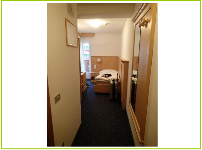
カナツェイのホテル

観光協会でリストアップされたホテルへ、バス停横の無料電話よりTEL、OK。ナビがどんどん山奥へ行くことするので、強引キャンセル、ナビで位置確認した2件目にスマホTELで、決まり。19:00前によく到着、疲れるな～。