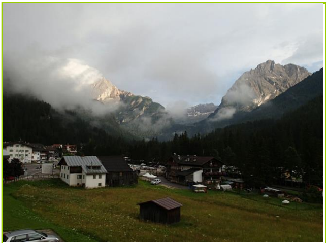
ホテルのベランダより

観光協会でリストアップされたホテルへ、バス停横の無料電話よりTEL、OK。ナビがどんどん山奥へ行くことするので、強引キャンセル、ナビで位置確認した2件目にスマホTELで、決まり。19:00前によく到着、疲れるな～。