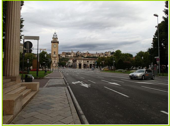
丘の上の中世の街・チッタ・アルタ

有名観光地の中心街だけあって、86.5€(¥12139)。パーキングメーター(宿泊者は、19:00-9:00のみ無料)を理解するのに手間取った。