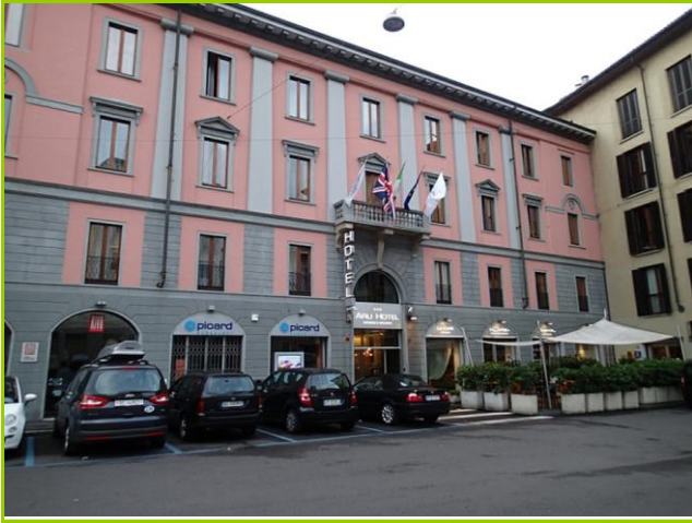
ベルガモのホテル

有名観光地の中心街だけあって、86.5€(¥12139)。パーキングメーター(宿泊者は、19:00-9:00のみ無料)を理解するのに手間取った。