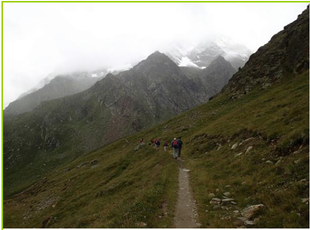
ミシャベル小屋方面へお散歩

ミシャベル小屋Mischabelhutte3329mへ行ったり、サースフェーへ下ったりしたいが、自重。