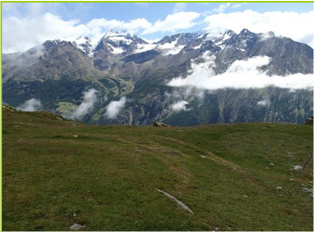
ラッギンホルン、ヴァイスミース