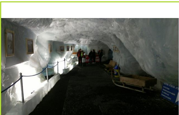
アイスパビリオン見学