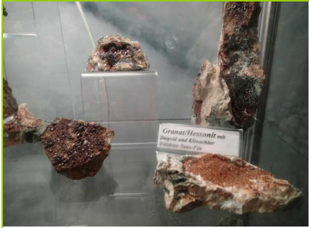
サースフェーの鉱物たち