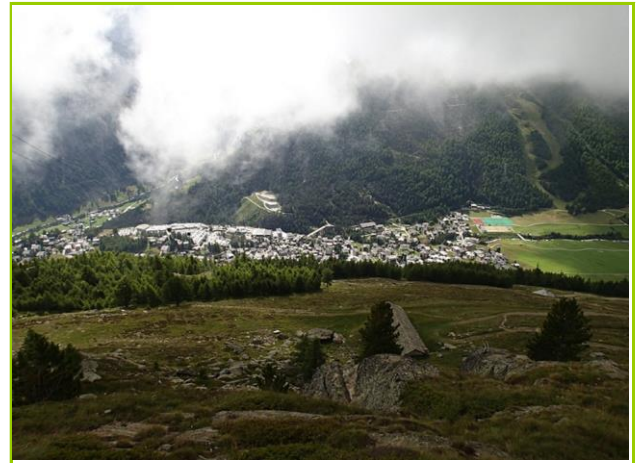
サースフェーの街